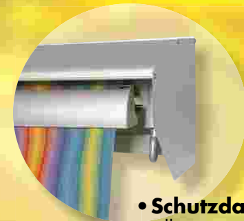
• Schutzdach silber